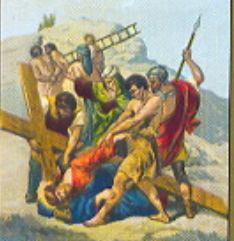
IX. STAZIONE Gesù cade la terza volta