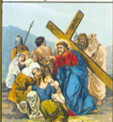
VIII. STAZIONE Gesù consola le pie donne