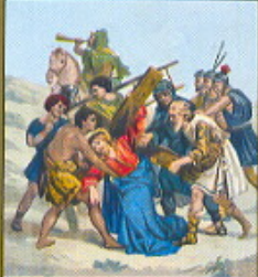
V. STAZIONE Gesù aiutato dal Cireneo