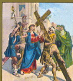
II. STAZIONE Gesù caricato della croce