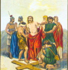
X. STAZIONE Gesù spogliato dalle vesti