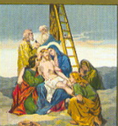
XIII. STAZIONE Gesù deposto dalla Croce