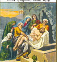
XIV. STAZIONE Gesù nel sepolcro