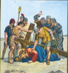
VII. STAZIONE Gesù cade la seconda volta