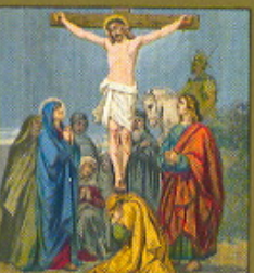
XII. STAZIONE Gesù morto in croce