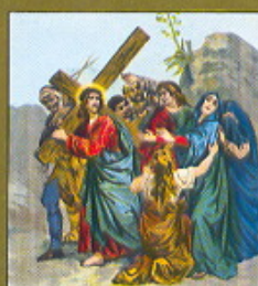
IV. STAZIONE Gesù incontra la sua SS. Madre