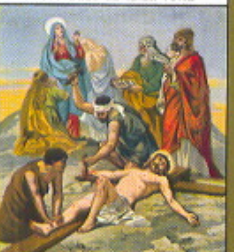
XI. STAZIONE Gesù inchiodato in Croce