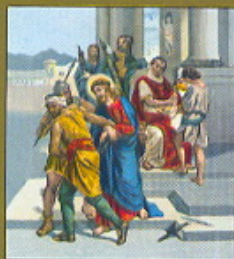
I. STAZIONE Gesù condannato a morte