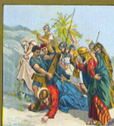
III. STAZIONE Gesù cade per la prima volta